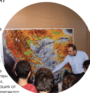
REGIONAL SEISMICITY MAP 1964-PRESENT