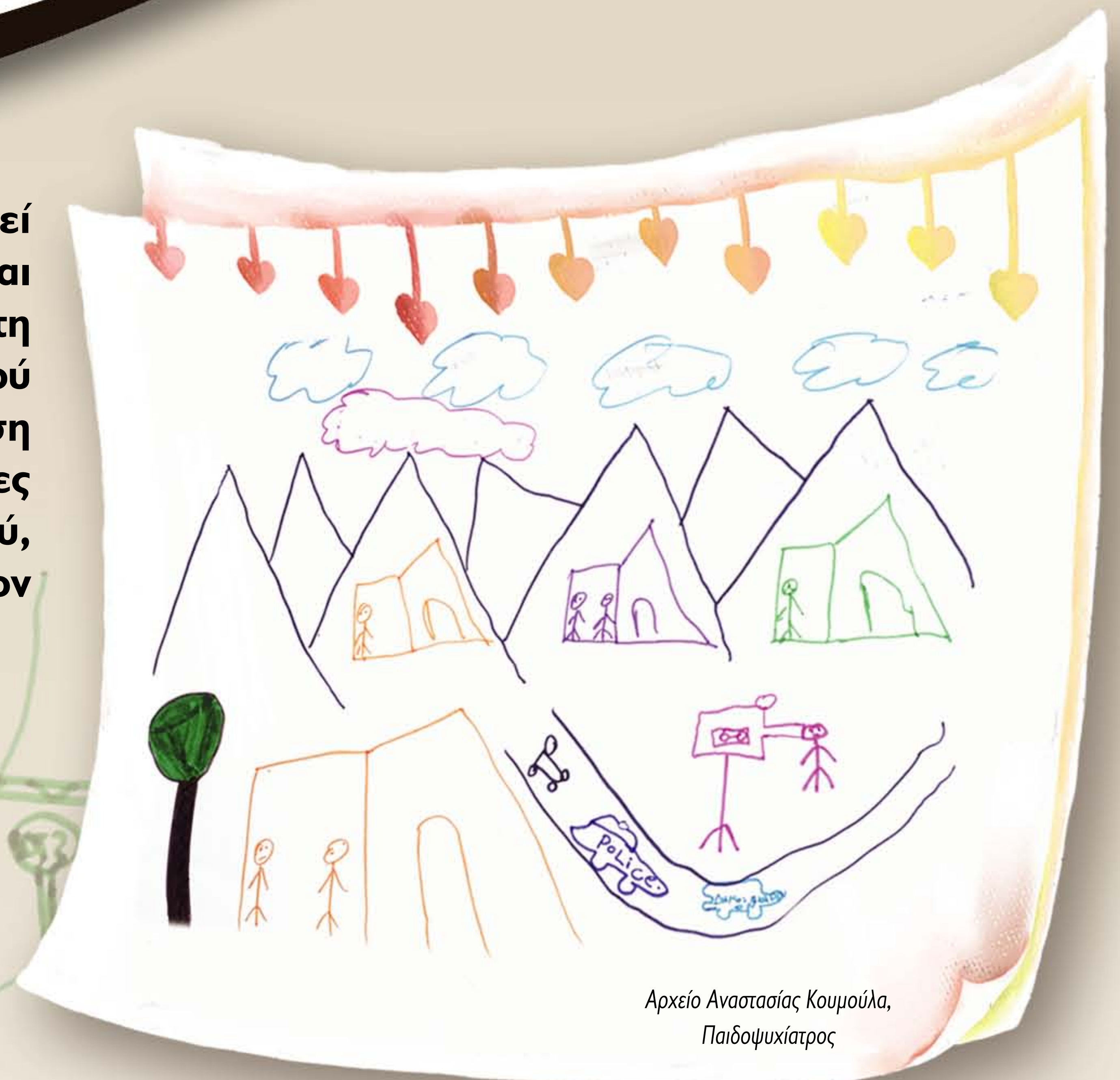
Αρχείο Αναστασίας Κουμούλα, Παιδοψυχίατρος

Ένα σοβαρό θέμα είναι η ανάγκη μετεγκατάστασης της οικογένειας όταν ο σεισμός έχει προκαλέσει σοβαρές ζημιές στο σπίτι. Από τη μια πλευρά, αυτό προσφέρει κάποια ανακούφιση διότι καταφεύγουν σε κάποιο πιο ασφαλές μέρος, από την άλλη όμως χάνεται η συλλογική αίσθηση της απώλειας που αναπτύσσεται με τους γείτονες, η οποία πολλές φορές έχει θεραπευτική επίδραση και οδηγεί σε ομαδικές δράσεις αποκατάστασης και επανοργάνωσης της ζωής.