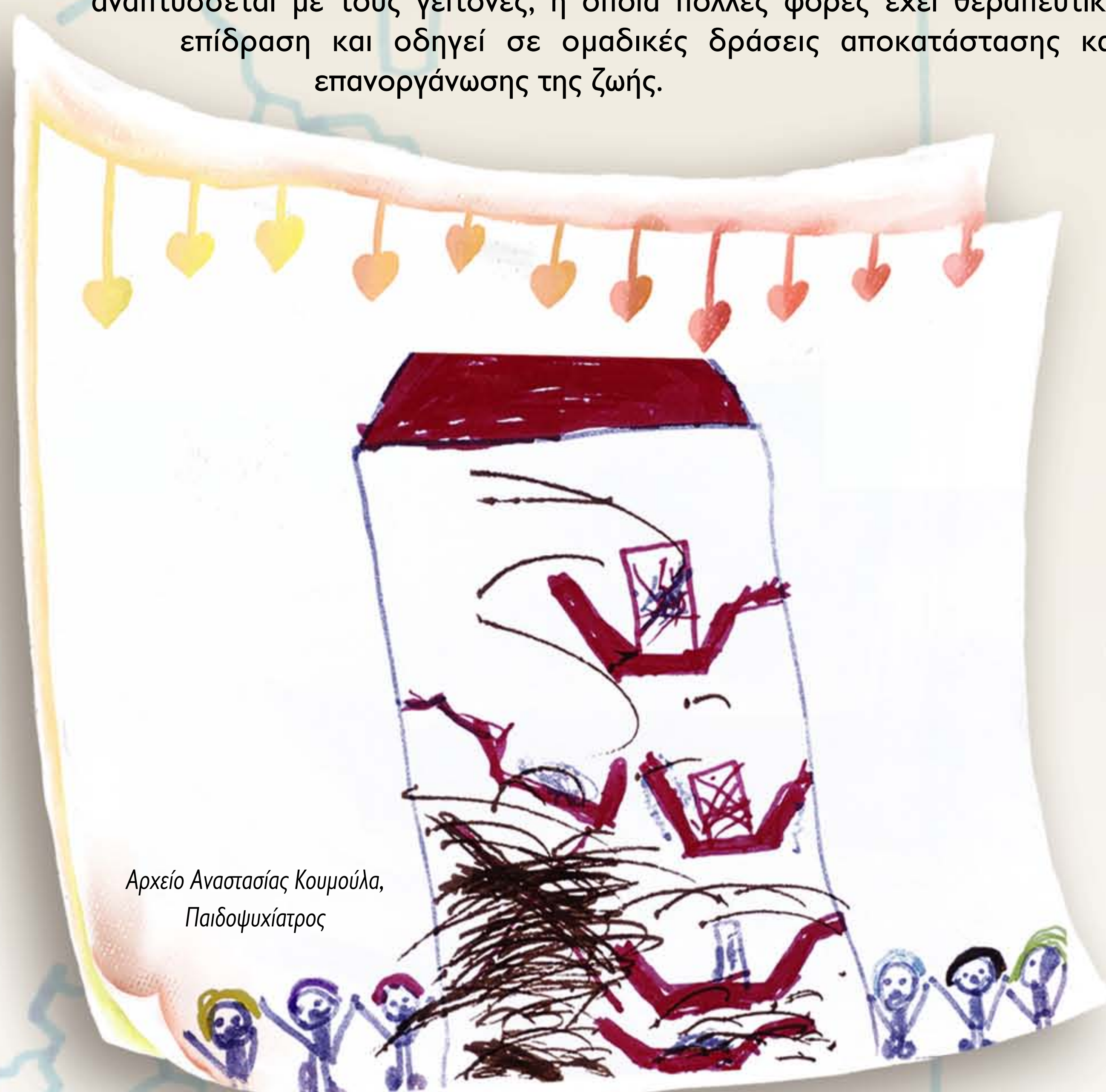
Αρχείο Αναστασίας Κουμούλα, Παιδοψυχίατρος

Εκτός από τη ΔΜΤΣ, συχνά εμφανίζονται στα παιδιά συμπτώματα κατάθλιψης. Άλλα δευτερογενή προβλήματα είναι: διαταραχές άγχους, άγχος αποκωρυσμού, αποφυγή του σχολείου, ψυχοσωματικά προβλήματα και ενούρηση.