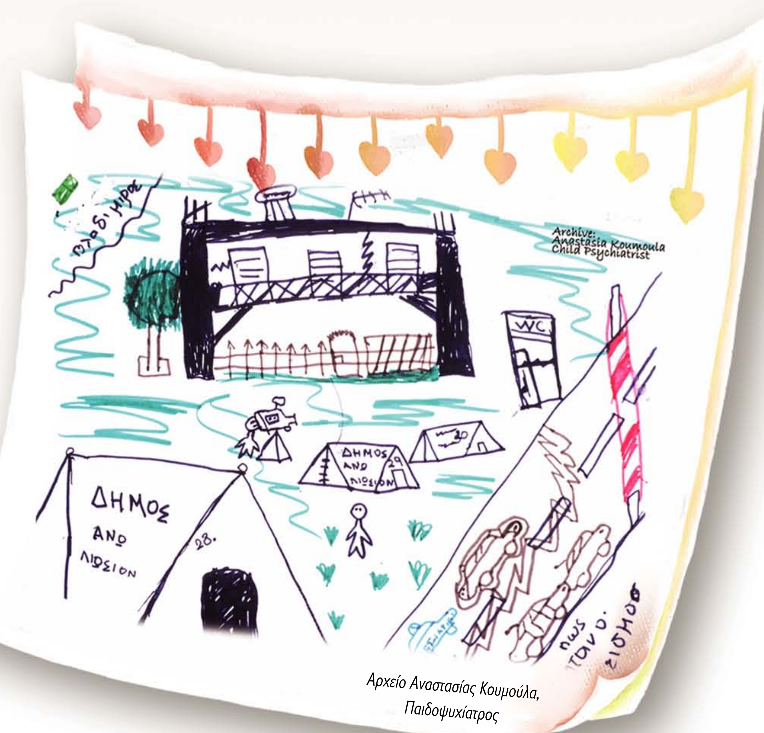
Αρχείο Αναστασίας Κουμούλα, Παιδοψυχίατρος

Για να τεθεί η διάγνωση της Διαταραχής Μετατραυματικού Στρες απαιτούνται τουλάχιστον ένα από τα συμπτώματα επαναβίωσης, τρία από τα συμπτώματα αποφυγής και δύο από τα συμπτώματα αυξημένης διεγερσιμότητας για διάρκεια μεγαλύτερη από ένα μήνα.